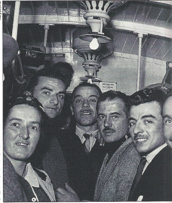
Début des années 50: une politique de laisser-faire qui sombrera en 1970

Mais l'économie en expansion, fondée sur la transformation de produits finis à l'usage des marchés extérieurs, va changer la nature des migrations. Les ouvriers italiens, par exemple, se concentrent sur les grands chantiers, le soir ils se regroupent dans certains quartiers ou quelques villages de baraquements. Ils sont peu intégrés. Sur les lieux de travail, les reproches et les ressentiments des ouvriers suisses s'accumulent devant ces Italiens qui acceptent des salaires plus bas ou sont employés comme briseurs de grève. Comme ils sont souvent moins instruits, et que cette ignorance se manifeste dans leur comportement, dans leur manque d'hygiène, ils sont souvent méprisés par leurs collègues indigènes. Ces oppositions tournent parfois au drame, comme on l'a vu à Berne en 1893 ou à Zurich en 1896.